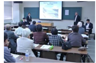
【研究発表大会分科会の様子】

なお、発表者の選考にあたっては、当学会で定める基準に 基づき選考の上、決定します。